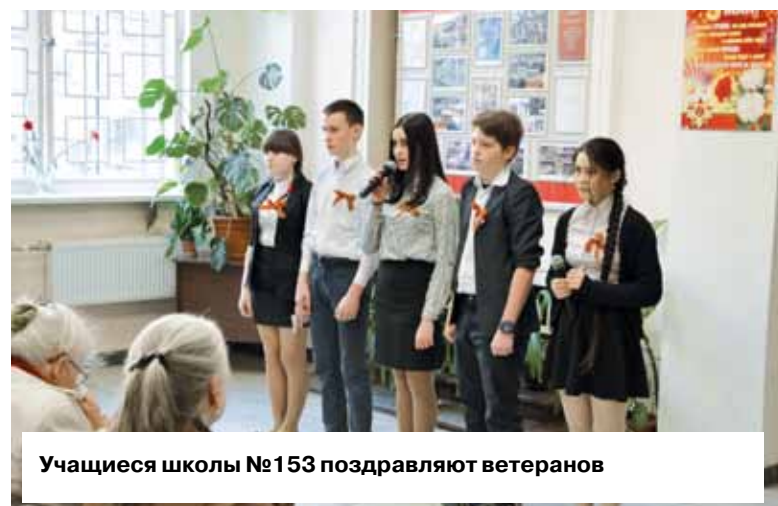
Учащиеся школы №153 поздравляют ветеранов