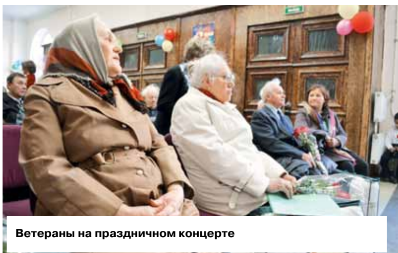
Ветераны на праздничном концерте