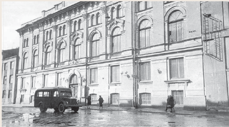
Клуб НКВД. 1940-е гг.

Таким образом, праздничное открытие нового сезона стало символом преемственности и единства культурных традиций. Культурный центр ГУ МВД России по г. Санкт-Петербургу и Ленинградской области по праву остается хранителем богатой истории и одновременно открывает новые горизонты, соединяя прошлое, настоящее и будущее в едином пространстве искусства, творчества и памяти.