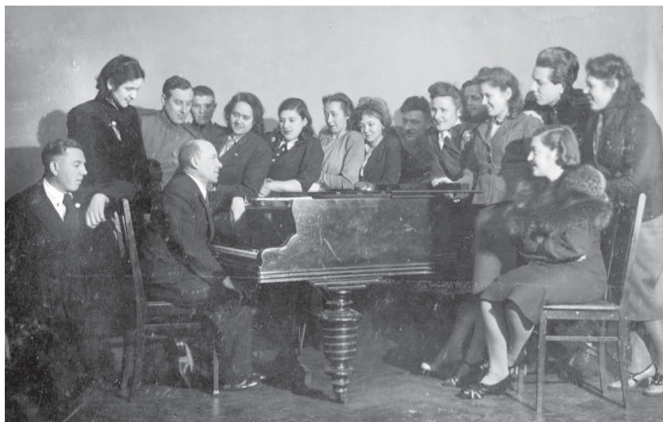
И.О. Дунаевский репетирует в клубе НКВД Ленинграда. 1944 г.