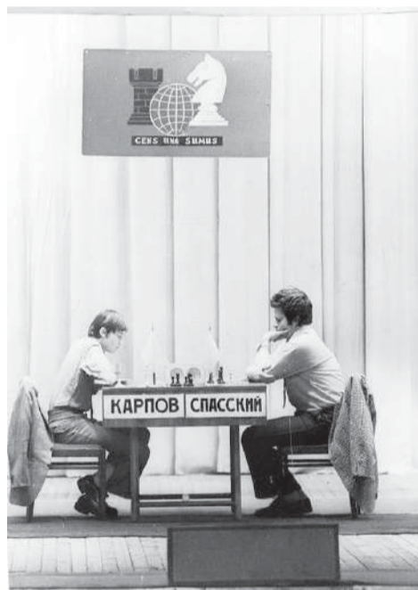
Шахматный турнир в ДК. 1974 г.