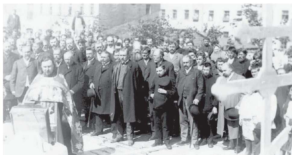
Молебен во время закладки здания биржи. 1907 г.