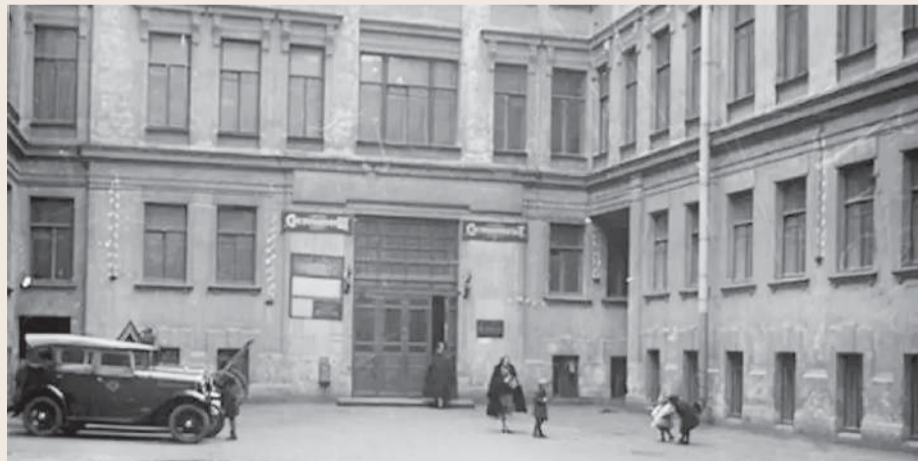
Полтавская, 12. 1930-е гг.

Наличие концертного зала во многом предопределило судьбу здания бывшей биржи после революции. В нем размещались различные учреждения, а с начала 1930-х годов – Дом культуры промкооперации. С 1940 года здание перешло в ведение Управления НКВД Ленинградской области, открылся Гарнизонный клуб милиции. В дни блокады это было едва ли не единственное культпросветучреждение Ленинграда, функционировавшее все 900 дней. Работали кружки, библиотека, проводились концерты и другие мероприятия. В 1964 году клубу присвоили статус Дворца культуры высшей категории и имя Ф.Э. Дзержинского. В 1997 году на базе Дворца культуры им. Ф.Э. Дзержинского, Музея Краснознаменной ленинградской милиции и Библиотеки ГУВД был создан Культурный центр Главного управления внутренних дел Санкт-Петербурга и Ленинградской области. Это уже новейшая история, которая продолжается в стенах легендарного здания.